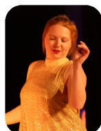
Cassandra Communication et partenariats